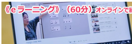
《eラーニング》(60分)オンラインで繰り返し学びます