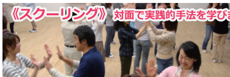
《スクーリング》対面で実践的手法を学びます

リズム、ティーチング、ピアノ演奏法というカリキュラムの他、子どもたちへの指導風景を見ることも出来ます。